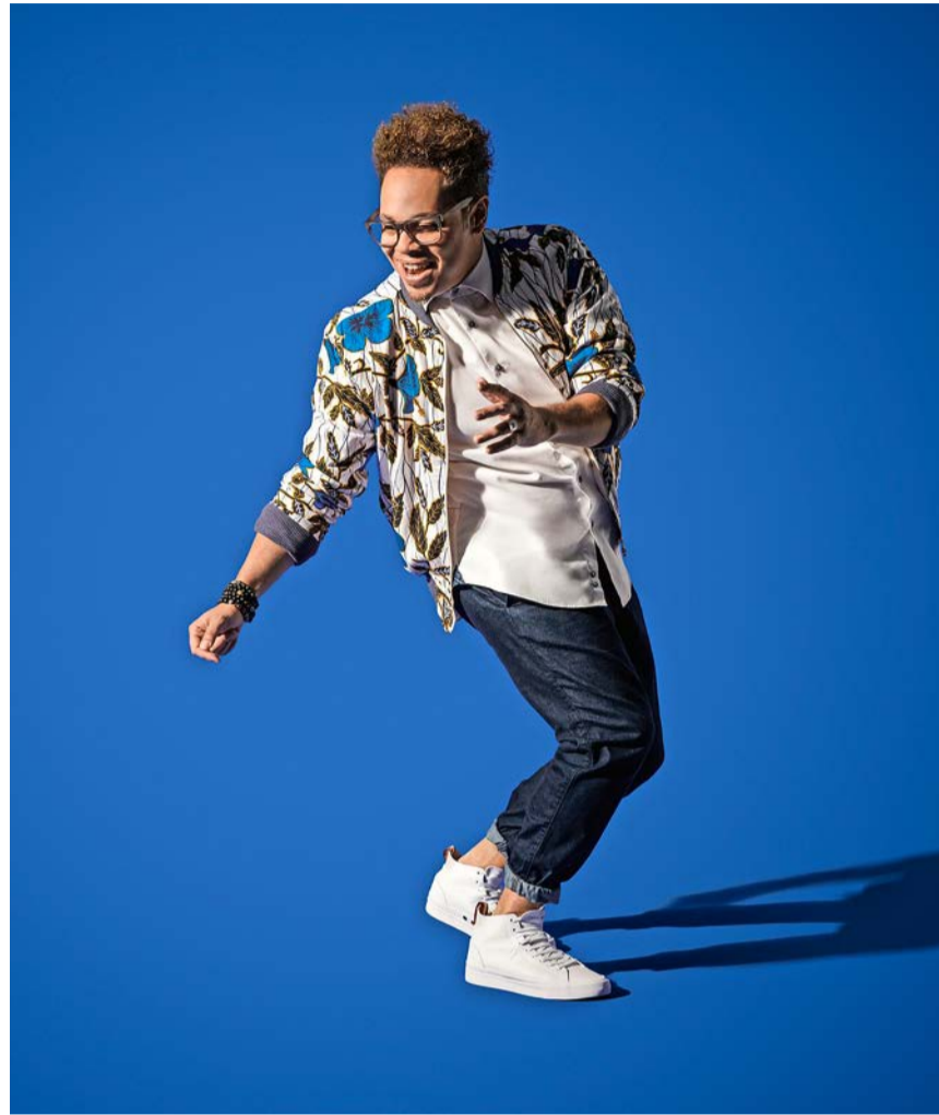
Der Pop-Rocker Marc Sway ist eine landesweit bekannte Musikgrösse.

Wer dem Gewerbeverein Reiat auf Instagram folgt, hat die Möglichkeit, an einem Wettbewerb teilzunehmen. Zu gewinnen gibt es zweimal zwei Tickets für das Marc-Sway-Konzert.