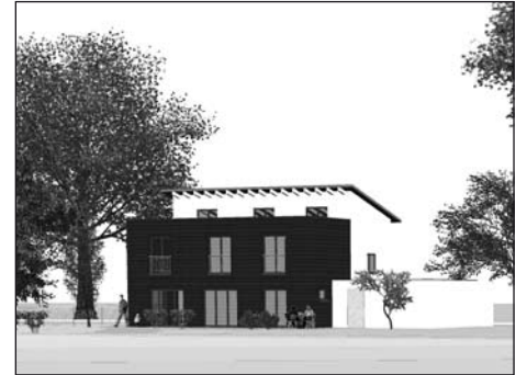
Projekt: M. Kummer und Partner

In Thayngen und dem gesamten Reiat entsteht einiges. Günstige Hypotheken, neue Bauzonen und verschiedene andere Gründe ermuntern bauwillige Personen, jetzt zu bauen.